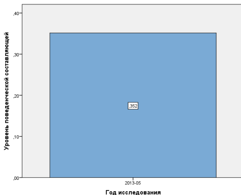
Рис.2. Диаграмма поведенческого компонента.

Для проведения данного анализа мы использовали аналогичную предыдущему анализу нормировку от -1 до +1 (Рис.2). Уровни поведенческого компонента группового восприятия также рассчитывались в линейном приближении по значениям средних. Для 2013 года общий уровень поведенческой составляющей равен 0,352.