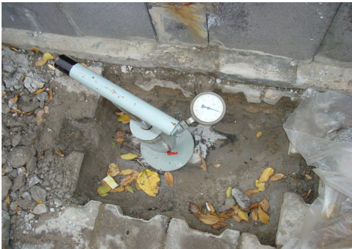
Рис.1 – Испытание гидроизоляционного покрытия прибором РНИИ АКХ

Для проверки на герметичность гидроизоляции были произведены вскрытия участков с тротуарной плиткой (рис.1). Испытания на герметичность проводилось двумя способами: методом пролива и проверка герметичности с помощью прибора конструкции РНИИ АКХ им. К.Д. Памфилова.