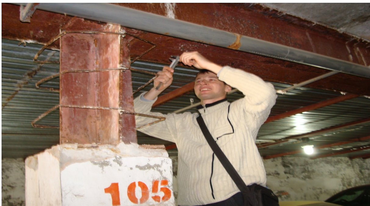
Рис.3 – Измерение толщины корродированного слоя металлоконструкции