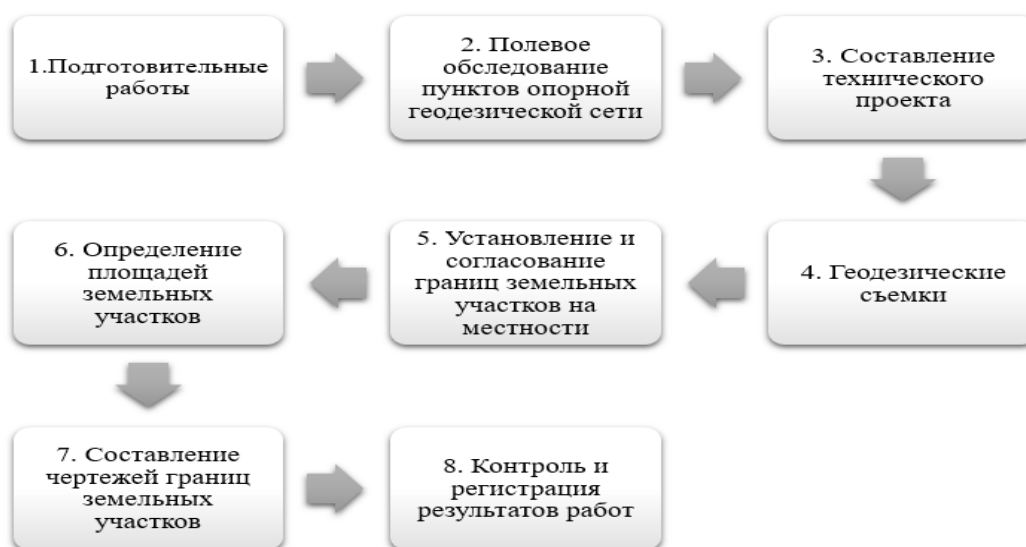
Рис. 2. – Этапы проведения геодезических работ

В большинстве случаев геодезические работы для обеспечения землеустроительных мероприятий осуществляют в несколько этапов, представленных на рис. 2.