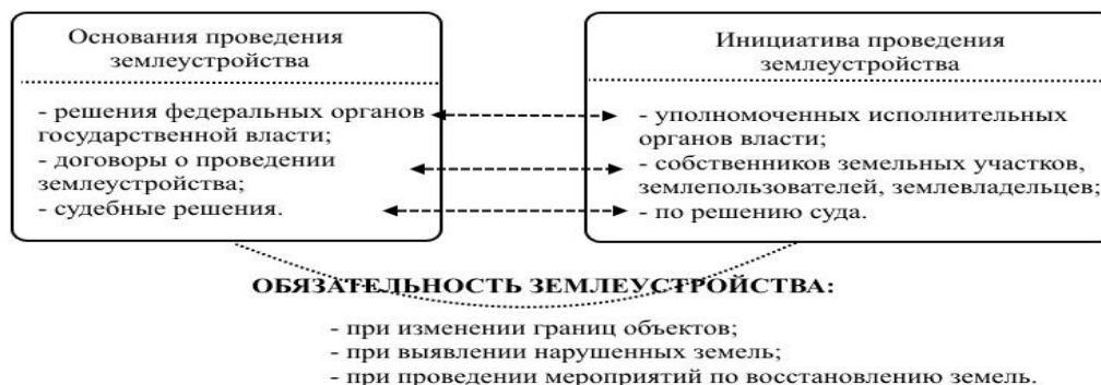
Рис. 1. – Особенности проведения землеустройства

части этих территорий. Технология организации, основания проведения и случаи, устанавливающие обязательность проведения землеустройства, представлены на рис. 1.