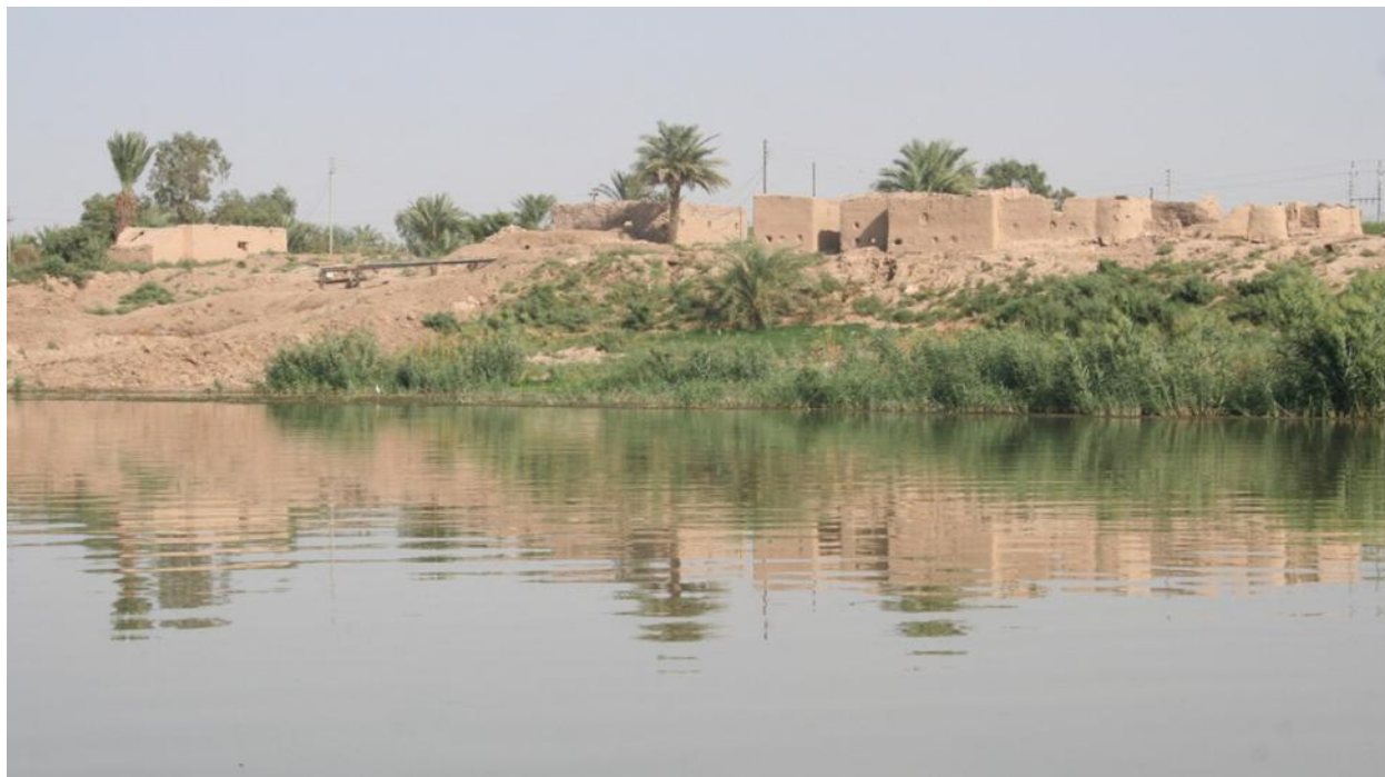
Рис. 1. Река Тигр. Фото вдоль Тигра, Южный Ирак * (Water, 2016)

составляет около 67 000 км 2 , что оказывает фундаментальное влияние на инфильтрацию соленой воды вдоль Шатт-эль-Араба.